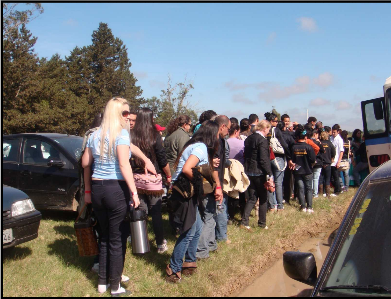
Elaboração e execução do roteiro turístico