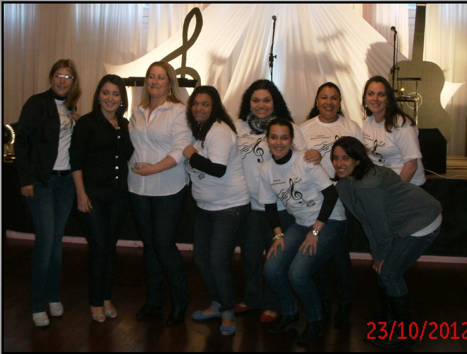
Grupo PET Turismo