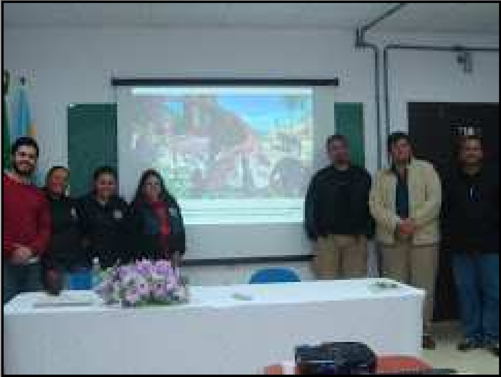
Seminário de Turismo e Paleontologia.